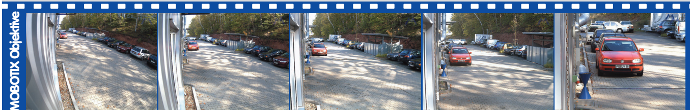
ca. 90°H x 67°V in 10 m ca: 20,0 x 13,3 m