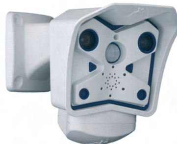
Outdoor-Wetterfest (IP65) (-30°C bis +60°C)